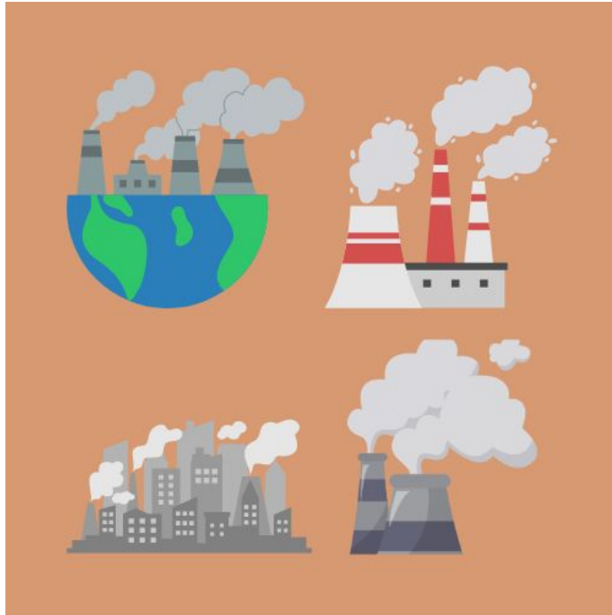
( ਗਵਾ ਯੂਦੁਸਣ )

ਗਵਾ ਯੂਦੁਸਣ ਦੇ ਰਾਸ਼ਣ - ਗਵਾ ਮਾਡੇ ਵਾਤਾਵਰਨ ਦਾ ਅਹਿਮ ਤੱਤ ਹੈ ਜਿਹੜੀ ਸਾਰੇ ਜੀਵ-ਜਗਤ ਨੂੰ ਜਿਉਂਦਾ ਰੱਖਣ ਲਈ ਜ਼ਰੂਰੀ ਹੈ, ਇਹ ਵੀ ਯੂਦੁਸਿਤ ਹੋ ਰਹੀ ਹੈ। ਮਾਡੇ ਵਾਤਾਵਰਨ ਵਿੱਚ ਰਾਸ਼ਣ-ਡਾਇਆਕਸਾਈਡ ਦੀ ਮਾਤਰਾ ਬਹੁਤ ਵਧ ਗਈ ਹੈ। ਕੋਲਾ, ਪਟਰੋਲ, ਡੀਜ਼ਲ ਅਤੇ ਹੋਰ ਬਾਲਣਾਂ ਦੀ ਵਧ ਰਹੀ ਵਰਤੋਂ ਇਸ ਦਾ ਮੁੱਖ ਕਾਰਨ ਹੈ। ਰਾਸ਼ਣਾਨਿਯੋਗ ਅਤੇ ਮੋਟਰ-ਗੱਡੀਆਂ ਤੋਂ ਖੈਦਾ ਹੋਣ ਵਾਲਾ ਜ਼ਹਿਰੀਲਾ ਯੂਯੂ ਗਵਾ-ਯੂਦੁਸਣ ਵਿੱਚ ਲਗਾਤਾਰ ਵਾਧਾ ਕਰ ਰਿਹਾ ਹੈ। ਸਰਕਾਰ ਦੁਆਰਾ ਖਾਬੰਦੀ ਲਾਏ ਜਾਣ ਦੇ ਬਾਵਜੂਦ ਕਣਕ ਅਤੇ ਝੋਨੇ ਦੀ ਨਾੜ ਨੂੰ ਅੱਗ ਲਾਈ ਜਾਂਦੀ ਹੈ ਜਿਸ ਨਾਲ ਖੈਦਾ ਹੋਇਆ ਮਣਾਂ-ਮੂੰਹੀ ਯੂਯੂ ਗਵਾ ਨੂੰ ਹੋਰ ਗੰਧਲਾ ਕਰਦਾ ਹੈ। ਫਰਿੱਜ ਅਤੇ ਏ. ਸੀ. ਆਦਿ ਵਿੱਚੋਂ ਨਿਕਲਣ ਵਾਲੇ ਕਲੋਰੋਫਲੋਰੋ ਕਾਰਬਨ, ਓਜ਼ੋਨ-ਖਰਤ ਲਈ ਖਾਤਰ ਹਨ ਅਤੇ ਇਹਨਾਂ ਨਾਲ ਓਜ਼ੋਨ-ਖਰਤ ਵਿੱਚ ਫੇਰ ਹੋ ਰਹੇ ਹਨ। ਆਲਮੀ ਤਖਮ (ਗਲੋਬਲ ਵਾਰਮਿੰਗ) ਵਧ ਰਹੀ ਹੈ ਜਿਸ ਨਾਲ ਗਲੋਮੀਅਰ ਖੱਘਰ ਰਹੇ ਹਨ ਅਤੇ ਸਮੁੰਦਰੀ ਪਾਣੀਆਂ ਦਾ ਖੱਘਰ ਵੀ ਉੱਚਾ ਹੋ ਰਿਹਾ ਹੈ। ਗਵਾ-ਯੂਦੁਸਣ ਕਾਰਨ ਮਾਗ-ਕਿਰਿਆ ਨਾਲ ਸੰਬੰਧਿਤ ਬਿਮਾਰੀਆਂ ਵਧ ਰਹੀਆਂ ਹਨ।