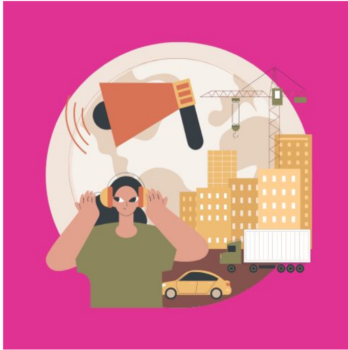
( ਯੁਨੀ-ਯੂਦੁਸਟ )

ਧੈਂਦਾ ਹੈ। ਇਸ ਤਰ੍ਹਾਂ ਦੇ ਫਲ, ਸਬਜ਼ੀਆਂ ਅਤੇ ਯਾਤਾਜ ਦੀ ਵਰਤੋਂ ਕਰਨ ਨਾਲ ਜੀਵਿਤ ਘਾਟੀਆਂ ਵਿੱਚ ਕਈ ਕਿਸਮ ਦੇ ਰੋਗ ਧੈਂਦਾ ਹੋ ਰਹੇ ਹਨ।